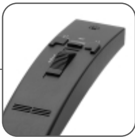
Mikrofonissa on ergonomisesti suunniteltu neliasentoinen käyttökytkin