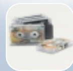
Mini Cassette 005