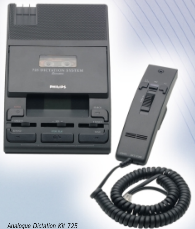
Analogue Dictation Kit 725 -pakkaukseen sisältyy: