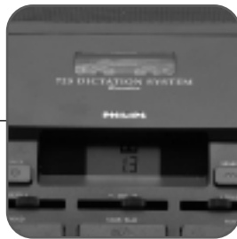
LCD-näyttö näyttää työtilanteen yhdellä silmäyksellä